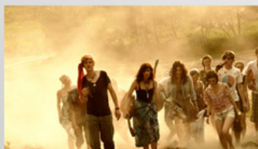
c Jan Richter