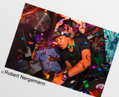
c Robert Nergemann

Die fotogruppe bickenbach richtet für den Deutschen Verband für Fotografie einen Wettbewerb für jugendliche Fotografen und Fotografinnen aus.